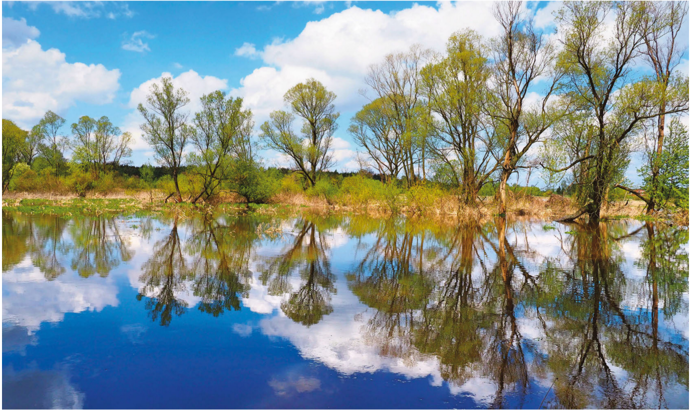
Trees in the clouds - Krzysztof Muskalski